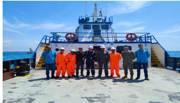
Shot on Leica 8 Pro 108MP